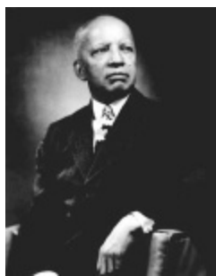
Dr. Carter Godwin Woodson

El Black History Month se celebra cada mes de febrero en toda América del Norte. Establecido en el año 1926 por el erudito Dr. Carter Godwin Woodson como un programa quincenal, en 1976 se convirtió en un evento de un mes de duración, integrado en el Bicentenario Americano.