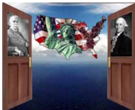
Centro de Recursos Informativos Amador Washington

Estas obras pueden ser consultadas en el Centro de Recursos Informativos Amador Washington ubicado en el Edificio Clayton, Clayton (antiguo Edificio 520) Teléfono: 227-7100 / Fax: 207-7363