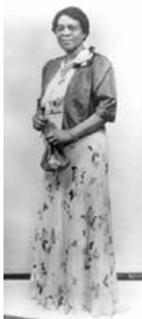
Charlotte Hawkins Brown "La Primera Dama de las Gracias Sociales"

Luego de un año de escuela junior, Brown aceptó un trabajo de 25 dólares por mes en la Asociación Misionaria Estadounidense (AMA) y volvió a su estado de origen para enseñar a los negros pobres del campo.