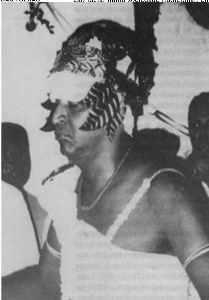
OSSÃE, ORIXÁ DAS FOLHAS.

que as estruturas sociais tinham mais o aspecto de estamentos que de classes, agora ele tem o sentido de escolha pessoal, livre, intencional: alguém adere ao candomblé não pelo fato de ser negro, mas porque sente que o candomblé pode fazer sua vida mais fácil de ser vivida, porque então talvez se possa ser mais feliz, não importa se se é branco ou negro. Estimativas recentes obtidas através de surveys nacionais atestam que os negros ainda hoje marcam maior presença nas religiões afro-brasileiras, onde somam, entre pardos e pretos, 42,7% da população adulta brasileira. Sua presença relativa sobe ainda mais no candomblé, originariamente a grande fonte de identidade negra, em que chegam a 56,8% — a única modalidade religiosa em que o negro é a maioria dos fiéis. Mas há muito branco nas religiões afro-brasileiras (51,2%) e mesmo no candomblé, em que representam 39,9%. Em números absolutos, os maiores contingentes negros são, evidentemente, católicos e em segundo lugar, evangélicos (Prandi, 1995).