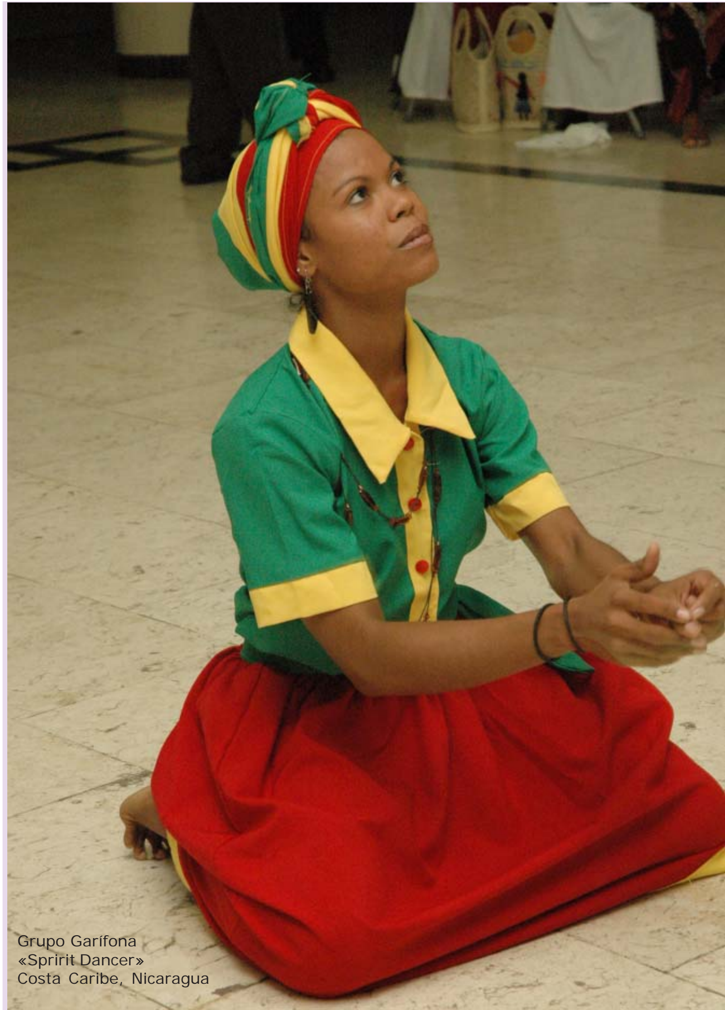
Grupo Garifona «Spirit Dancer» Costa Caribe, Nicaragua