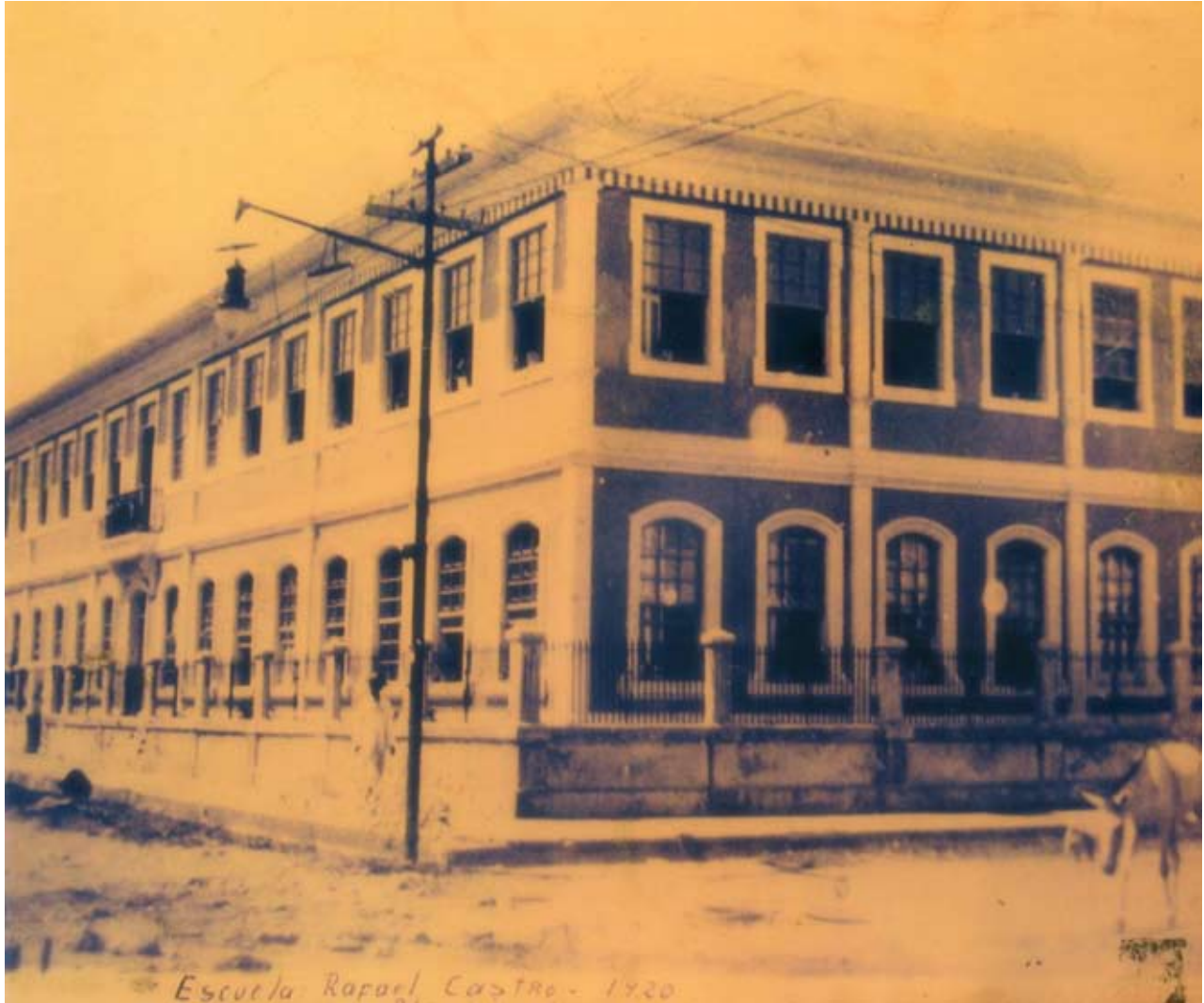
Escuela Rafael Iglesias Castro de Puerto Limón. Vista del costado suroeste. Año 1920.

Nuevamente se tiene noticias de las escuelas de Limón en el Informe de la misma Secretaría de Instrucción referente al año 1912 donde se menciona del funcionamiento de 383 escuelas en toda la República, 13 de las cuales se encontraban en Limón con 946 estudiantes, de los cuales, 500 eran costarricenses y 446 extranjeros (ANCR, 21146:110). Recordemos que en los documentos oficiales del Estado costarricense el término extranjero se refería, en el caso de Limón, a los ciudadanos de origen jamaquino o antillano, de donde intuimos que los 446